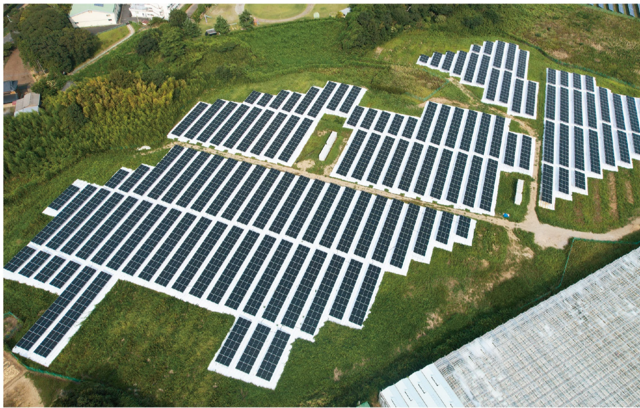
ブルースカイソーラーでは発電所の新規開発だけでなく、再生事業にも積極的に取り組む。

全国で太陽光発電所開発を手掛けるブルースカイソーラーでも、再生事業に積極的に取り組んでいる。同社の主な手法は、太陽光パネルを片面タイプから両面タイプへ取り換え、反射シートを敷設することで発電量の向上とメンテナンス